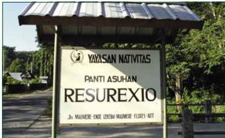
Lekebai: Resurexio – 115 kinderen