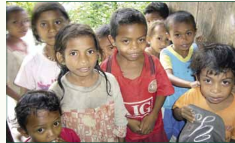
Labuan Bajo: Tarsi – 63 kinderen

In Labuan Bajo is de stichting begonnen met verschillende projecten. 63 kinderen uit deze omgeving zitten in het project (TARS).