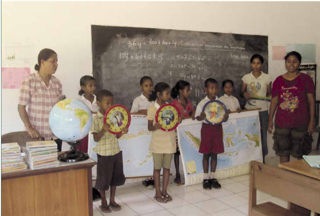
Schoolspullen voor diverse scholen