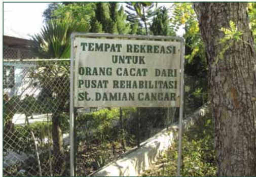
Labuan Bajo/Cancar: St. Damian – 50 kinderen