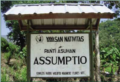
Wolofeo: Assumptio – 92 kinderen