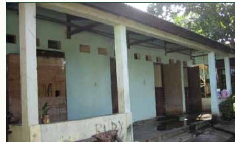
Alor: St. Damian – 53 kinderen

In Labuan Bajo is de stichting begonnen met verschillende projecten. 63 kinderen uit deze omgeving zitten in het project (TARS).