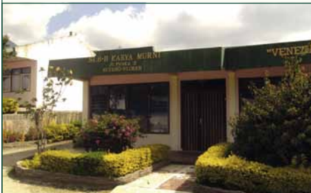
Ruteng: SLB Karya Murni – 100 kinderen